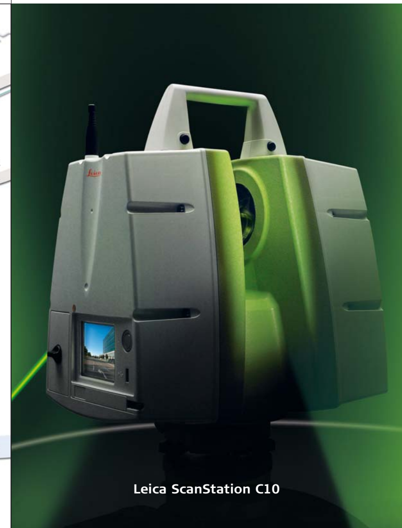
Leica ScanStation C10

Invitation à la journée GEOMATIQUE-News à l'HEIG-VD le 16 mars 2010