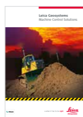
Brochure Solutions Leica pour guidage d'engins