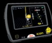
Ecran de contrôle iCP40