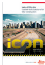
Leica iCON site Catálogo