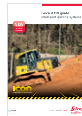
Leica iCON Nivelación Catálogo