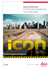
Catálogo Leica iCON site Catálogo