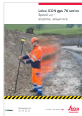
Serie Leica iCON gps 70 Catálogo

Las ilustraciones, descripciones y datos técnicos no son vinculantes; Todos los derechos reservados. Impreso en Suiza – Copyright Leica Geosystems AG, Heerbrugg, Suiza, 2022. 971949es – 09.22