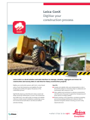
Leica ConX Folleto