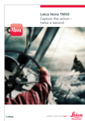
Leica Nova TM50 Termék brosúra