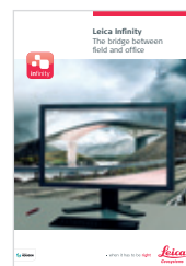
Leica Infinity Szoftver brosúra