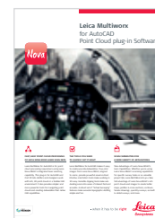
Leica MultiWorx Szoftver brosúra