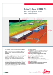
Leica Cyclone MODEL