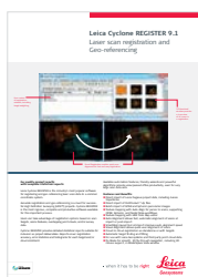
Leica Cyclone REGISTER